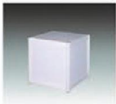
D-1 低展台 LOW SHOWCASE 500*500*500