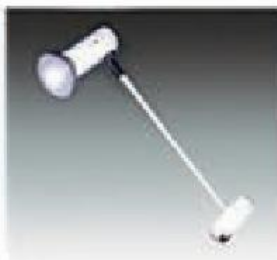
F-3 长臂射灯 LONG SPOT LIGHT