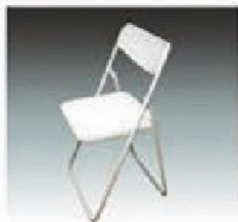
B-2 40 型折椅 40 FOLDING CHAIR