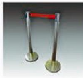
F-4 1米围栏 TOW POLES WITH 1M CHAIN