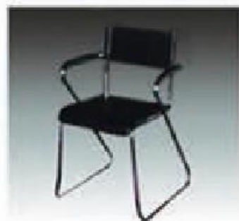
B-1 会议椅 CONFERENCE CHAIR