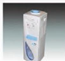
F-9 饮水机 DRINKING FOUNTAIN