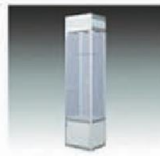
C-4 B 玻璃柜 B GLASS CUPBOARD 500*500*2200