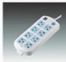
F-10 电源插座 SOCKET