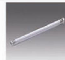
F-11 日光灯 FLUORESCENT TUBE