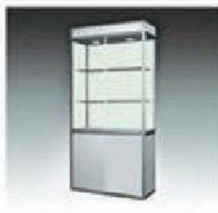
C-3 A 玻璃柜 A GLASS CUPBOARD 1000*500*2000