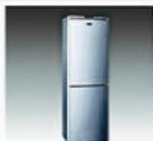
F-6 冰箱 REFRIGERATOR