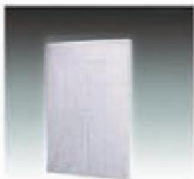
F-1 匙孔板 APERTURE BOARD 1415*975