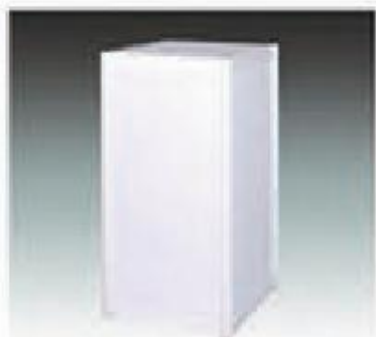
D-2 高展台 HIGH SHOWCASE 500*500*1000