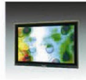
F-5 等离子 (42")(50") PLASMA SCREEN (42")(50")