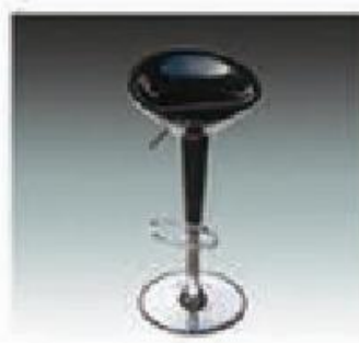
B-3 升降吧椅 BARSTOOL