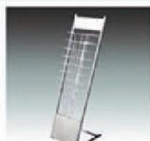
F-8 9层资料架 BROCHURERACK 1150*250