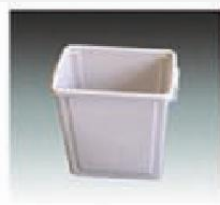
F-7 废纸篓 WASTE BASKET