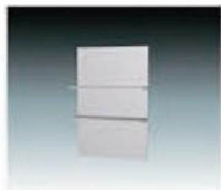
E-1 搁板 (A)