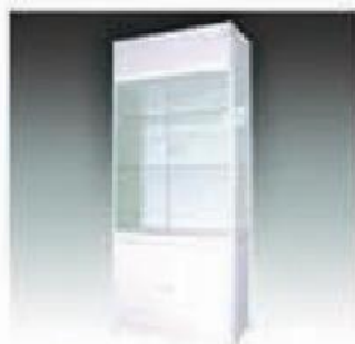
C-2 高玻璃柜 HIGH GLASS CUPBOARD 1000*500*2200