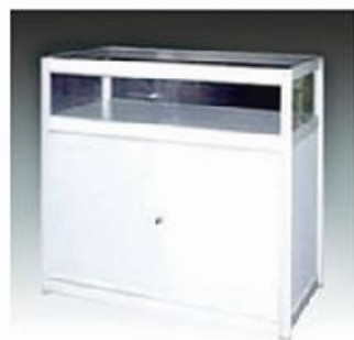
C-1 低玻璃柜 LOW GLASS CUPBOARD 1000*500*1000